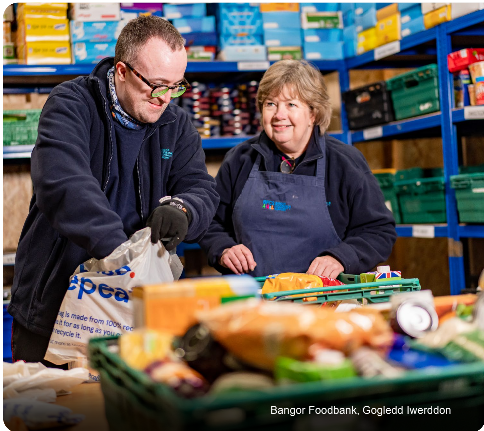
Bangor Foodbank, Gogledd Iwerddon