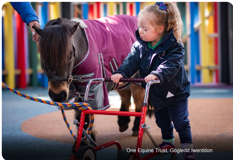
One Equine Trust, Gogledd Iwerddon