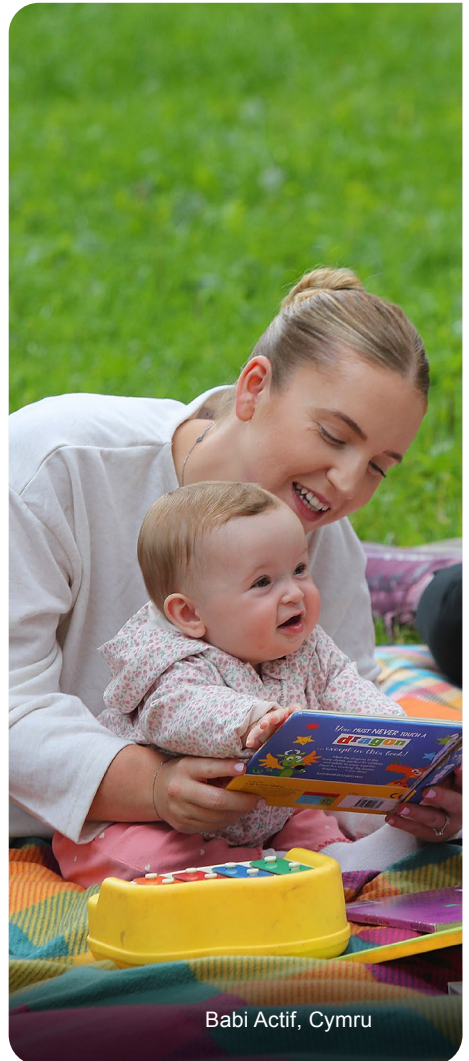
Babi Actif, Cymru

Gofynnwn i bob ymgeisydd gwblhau ffurflen monitro amrywiaeth. Rydym yn gobeithio y byddwch chi'n ein helpu trwy ddarparu'r wybodaeth hon.