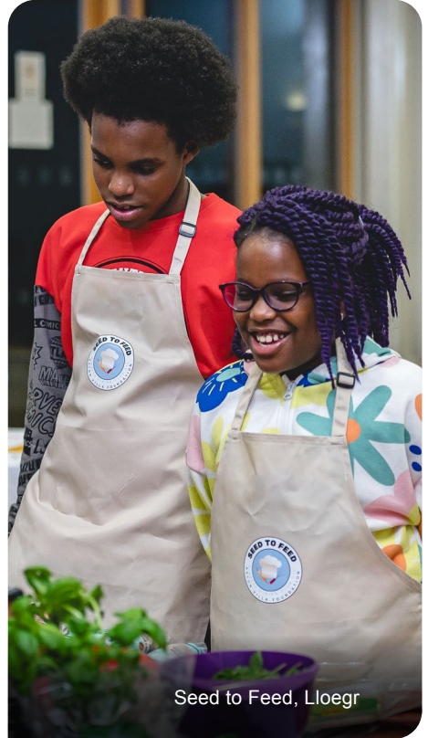
Seed to Feed, Lloegr