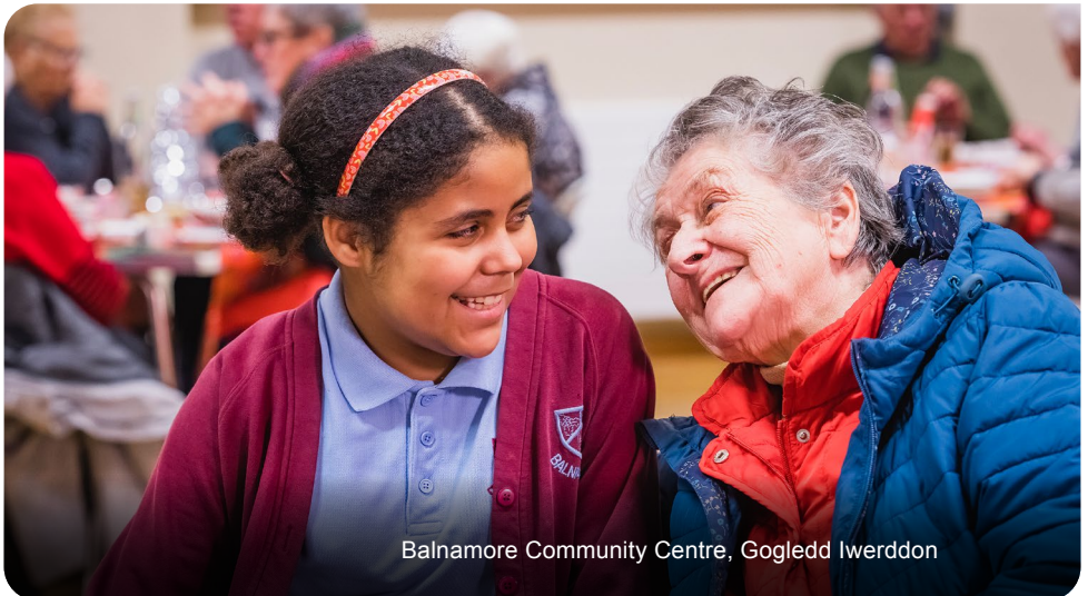
Balnaree Community Centre, Gogledd Iwerddon