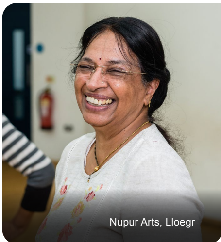
Nupur Arts, Lloegr

Mae DCMS wedi ymrwymo i ddileu gwahaniaethu a hyrwyddo cyfle cyfartal yn ei benodiadau cyhoeddus. Rydym yn annog ymgeiswyr o grwpiau sydd wedi'u tangynrychioli, y rhai sydd wedi'u lleoli y tu allan i Lundain a'r De-ddwyrain ac ymgeiswyr sydd wedi cyflawni llwyddiant trwy lwybrau addysgol anhraddodiadol. Mae hyn yn sicrhau bod byrddau cyrff cyhoeddus yn elwa o ystod lawn o safbwyntiau amrywiol ac yn gynrychioliadol o'r bobl y maent yn eu gwasanaethu. Bydd hyn yn cynnwys hyrwyddo cyfleoedd i bawb ar draws y sefydliad, gan helpu sicrhau bod y sefydliad yn un lle gellir mynegi ystod wirioneddol amrywiol o safbwyntiau, heb ofn na ffafr.