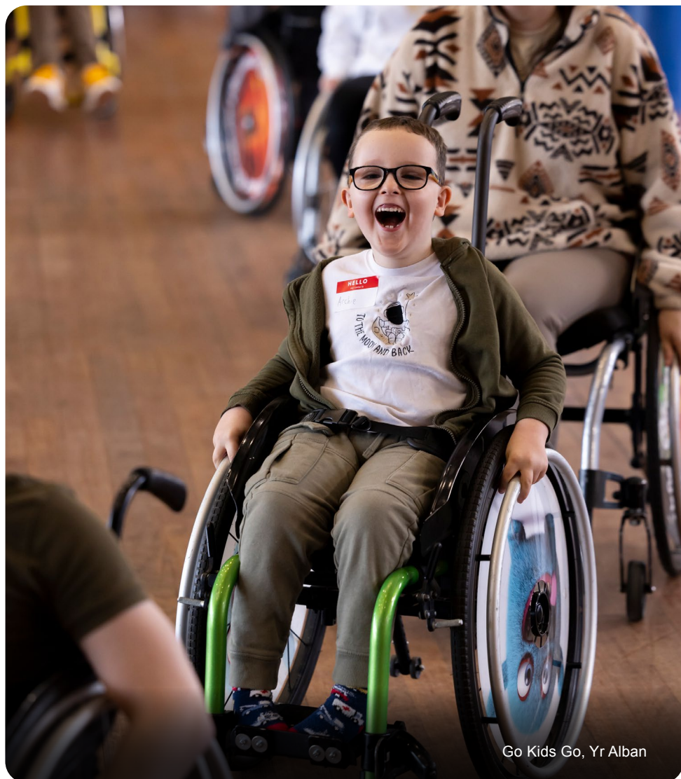
Go Kids Go, Yr Alban