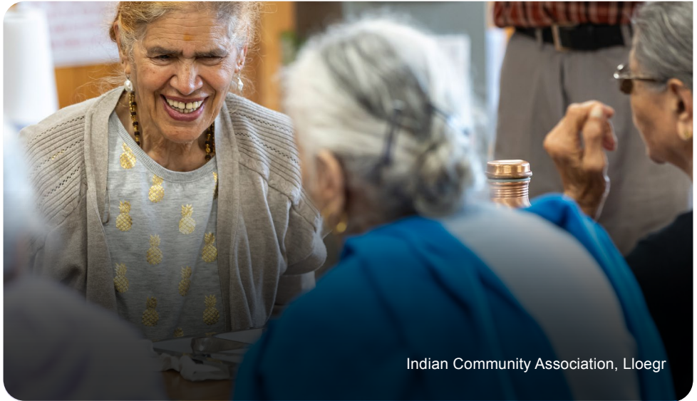
Indian Community Association, Lloegr