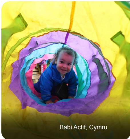
Babi Actif, Cymru