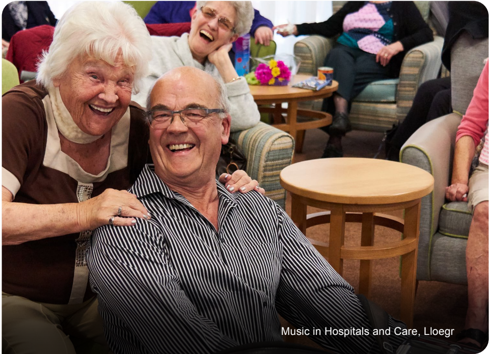
Music in Hospitals and Care, Lloegr

Rydym yn ceisio gwarantu cyfweiliad i unrhyw un ag anabledd y mae eu cais yn bodloni'r meini prawf lleiaf ar gyfer y rôl. Trwy 'meini prawf lleiaf', rydym yn golygu bod yn rhaid i chi ddarparu tystiolaeth yn eich cais, sy'n dangos eich bod yn bodloni'r lefel o gymhwysedd sy'n ofynnol o dan bob un o'r meini prawf hanfodol. Os hoffech wneud cais o dan y cynllun hwn, nodwch hyn yn yr e-bost neu lythyr eglurhaol wrth gyflwyno eich cais neu cysylltwch â'r tîm. Ni fydd hyn yn amharu ar eich cais mewn unrhyw ffordd.