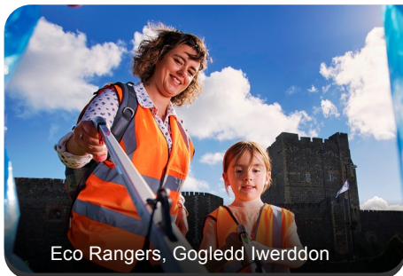
Eco Rangers, Gogledd Iwerddon

Y Gronfa yw'r ariannwr cymunedol mwyaf yn y DU ac mae'n gyfrifol am ddsbarthu 40% o gyfanswm yr arian achosion da a godir drwy'r Loteri Genedlaethol. Gyda Swyddogion Ariannu wedi'u lleoli mewn cymunedau ledled y DU, mae'r Gronfa'n canolbwyntio lle mae'r angen mwyaf. Maen nhw'n ariannu prosiectau sy'n cyflawni pedwar nod cymunedol: cefnogi cymunedau i ddog ynghyd, helpu plant a phobl ifanc i ffynnu, galluogi pobl i fyw bywydau iachach a bod yn gynaliadwy'n amgylcheddol.