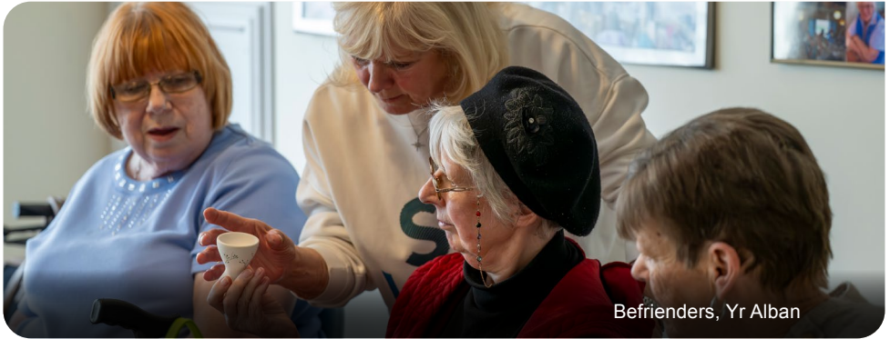
Befrienders, Yr Alban